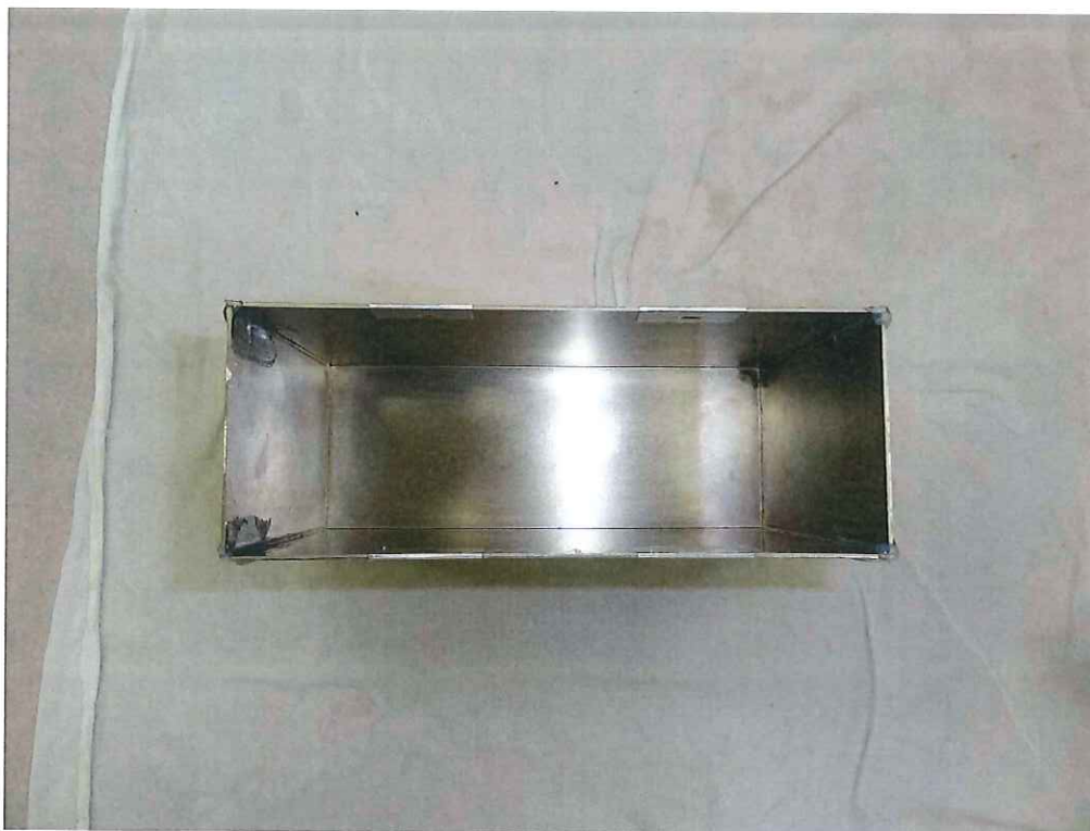
写真 3 IPX7 試験後の内部確認の様子